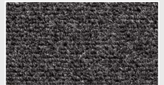
FORTUS 12 mm, Anthrazit

Versenkt verlegt: SCHEYBAL Alu-Winkelrahmen AS 1/8 bzw. ABS 1/10 ab 2 m 2 vollflächige Verklebung empfohlen