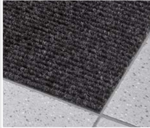
RIMO V1 10 mm, Anthrazit