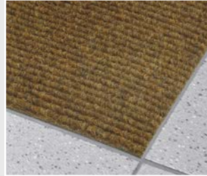
RIMO V2 10 mm, Natur