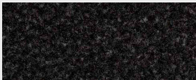
Texwell SUPER R9 anthrazit